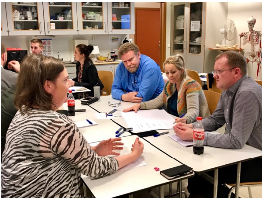
Mynd 1 Frá vinnustofu I

Á öðrum vinnufundi var farið yfir áhersluatriði og verkefni, og kortlagðar þær aðgerðir sem nauðsynlegt er að grípa til, svo stefnunni verði komið til framkvæmda.